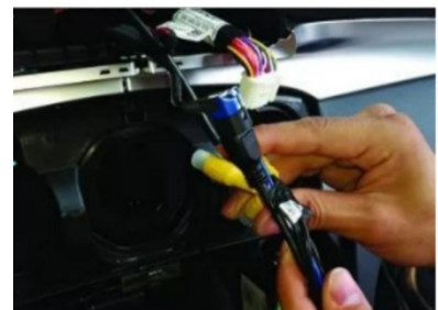
15. Schließen Sie den Original-Bildschirmstecker an.