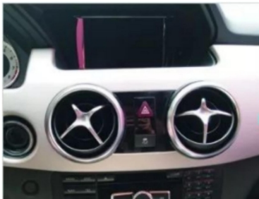
1. Zentrale Steuerung des Originalfahrzeugs