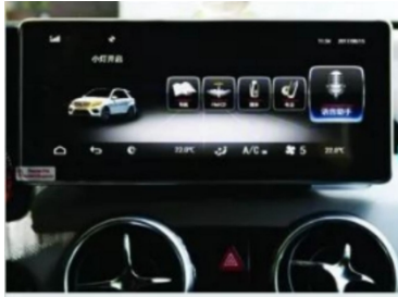
19. Effektbild nach der Installation