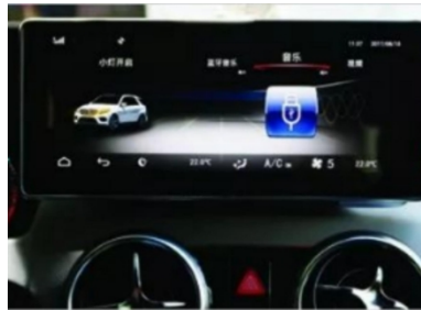
17. Effektbild nach der Installation