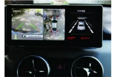
21. Effektbild nach der Installation