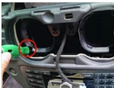
10. Lösen Sie die Befestigungsschrauben des Originalmotors