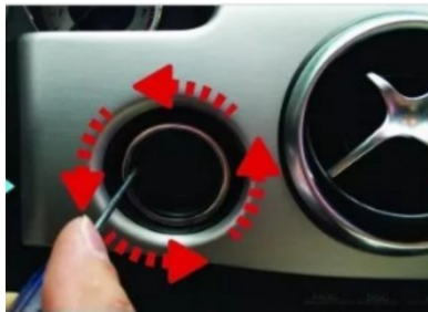
2. Sprechen Sie zwei kleine Worte. Der silberne Kreis dreht sich gegen den Uhrzeigersinn