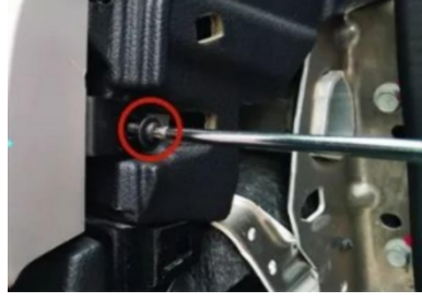
5. Entfernen Sie die Befestigungsschrauben des Luftauslasses