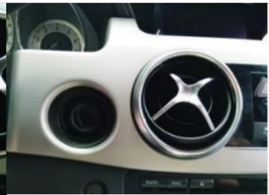
3. Effektbild nach dem Entfernen des silbernen Rings