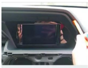
7. Den originalen Bildschirmrahmen heraushebeln