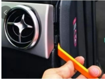
4. Die Seitenverkleidung des Handschuhfachs aufhebeln