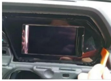
8. Hebeln Sie den ursprünglichen Bildschirmrahmen heraus