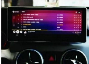
20. Effektbild nach der Installation