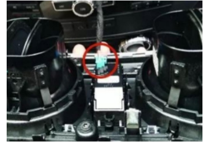
6. Hebeln Sie die Luftabflußblende heraus und ziehen Sie den Stecker der Notbeleuchtung heraus.