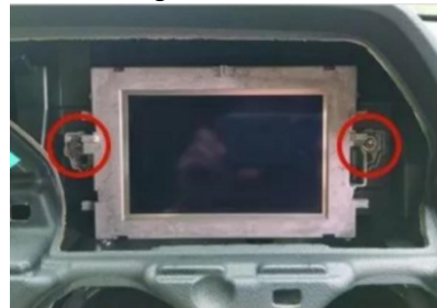
9. Entfernen Sie die Originalblende.