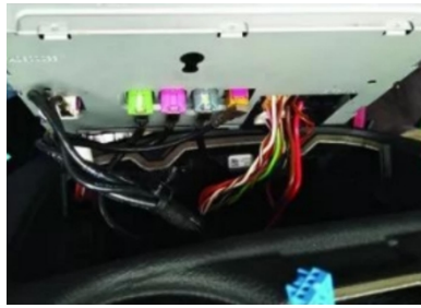
14. Ziehen Sie den Original-Fahrzeugstecker ab