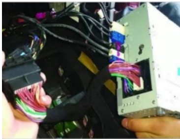
16. Schließen Sie den Original-Motorstecker an.