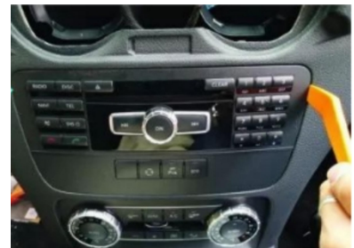
12. Hebeln Sie vorsichtig den Hauptmotor des Originalfahrzeugs heraus.