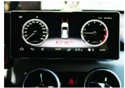
18. Effektbild nach der Installation